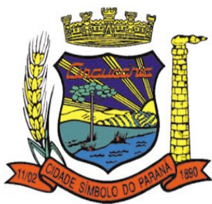
BRASÃO DE ARAUCÁRIA