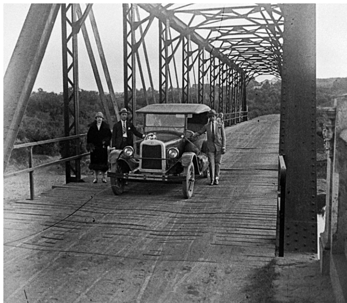
Ponte sobre o Rio Iguaçu, Araucária, 1923.

O município foi criado pelo Decreto Estadual nº 40 de 11 de fevereiro de 1890 e recebeu o nome de Araucária por sugestão do médico Dr. Victor Ferreira do Amaral.