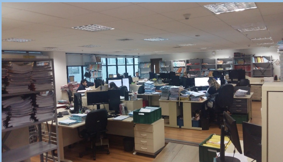
Assessoria de Recursos é o setor responsável pelo exame dos recursos aos Tribunais Superiores