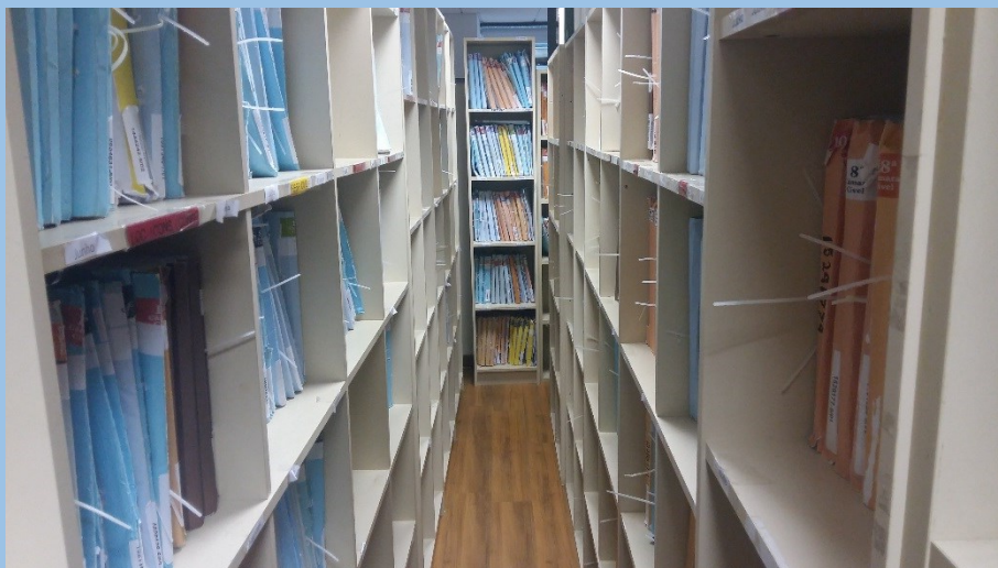
Grande volume de recursos dirigidos aos Tribunais Superiores

de juros com periodicidade inferior a um ano nas operações realizadas pelas instituições integrantes do Sistema Financeiro Nacional. Os dois temas correspondem a 517 recursos sobrestados.